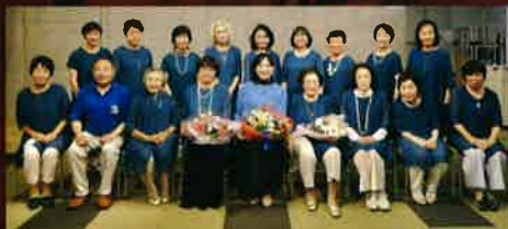
コーラスグループ InCanto